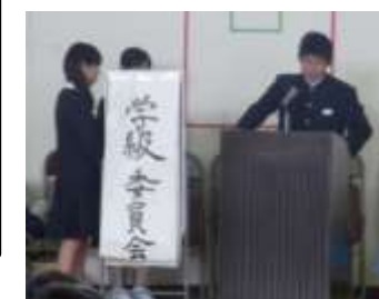
〈学級委員会の説明〉