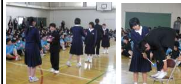
〈新入生へ花のプレゼント〉 〈服装の説明〉

1年生から3年生が互いに「心の通い合う」場面等が数多くありましたので紹介します。